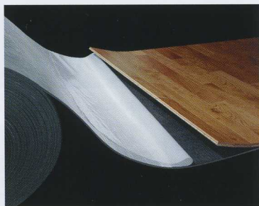
Una vez extendida la base autoadhesiva Elastilon sobre el suelo, se colocan sobre ella las lamas machihembradas, retirando seguidamente la capa protectora entre la tarima y la base.

ELASTILON B.V. Vaalserbergweg, 12 5628 CJ Eindhoven. Holanda Tel.: +(31) 40 242 6136. Fax: +(31) 40 248 0249 info@elastilon.com www.elastilon.com