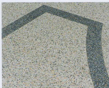
TerrazzoPlus, con espesores a partir de 25 mm, admite tráfico peatonal intenso.

TerrazzoPlus y TerrazzoMicro son pavimentos tipo terrazo continuo que se caracterizan por su reducido espesor y su rapidez de ejecución. Están compuestos por una matriz cementosa y áridos. La matriz tiene endurecimiento inicial rápido. Se fabrica en colores blanco y negro; la blanca puede colorearse con los tintes suministrados por la empresa. Los áridos están disponi-