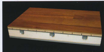
La buena transmisión térmica de Elastilon Lock lo hace apto para suelos radiantes.