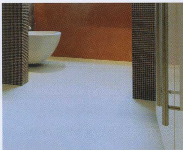
TerrazzoMicro permiten realizar pavimentos continuos de terrazo con espesores a partir de 11 mm.

ARDEX GMBH Friedrich-Ebert-Strasse 45 58453 Witten. Alemania Tel.: +(49) 2302 664 0. Fax: +(49) 2302 664 375 kundendienst@ardex.de www.pandomo.de