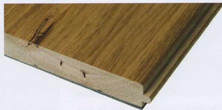
Elastilon Basic para madera maciza está disponible en 3, 5 y 10 mm.

-Removable, la capa autoadhesiva permite su retirada sin dejar restos, por lo que puede reutilizarse o recibir un suelo nuevo. Apto para suelos de corcho, linóleo, mármol, cerámica y pavimentos laminados, en lugares donde los suelos deban ser reemplazados con frecuencia e inmediatez de uso, como stands en ferias.