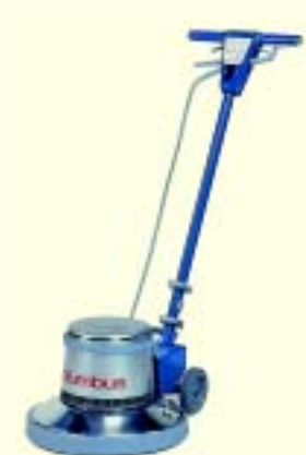
COLUMBUS 135 SH